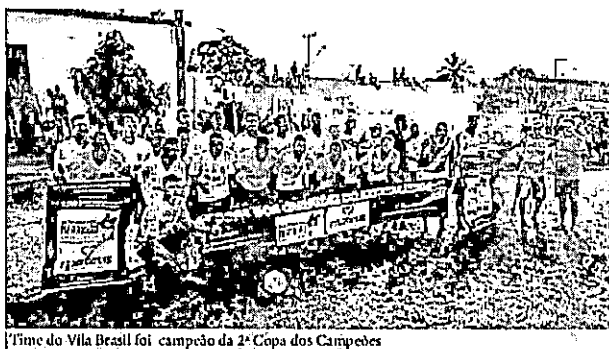
Time do Vila Brasil foi campeão da 2ª Copa dos Campeões

Departamentos e Clubes de Futebol Amador do Maranhão programou os jogos de volta da Copa dos Campeões do Interbairros que irão definir os semifinalistas. Real Madrid e Juventus jogam às 10h, no campo do Real, no Parque