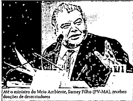
Até o ministro do Meio Ambiente, Sarney Filho (PV-MA), recebeu doações de desmatadores

Quase metade dos deputados federais eleitos para a atual legislatura recebeu financiamento de doadores que estão na lista de autuados do Ibama (Instituto Brasileiro do Meio Ambiente e dos Recursos Naturais Renováveis). Dos 513 eleitos, 249 receberam um total de R$ 58,9 milhões em doações oficiais de empresas e pessoas que desmataram e queimaram florestas, entre outros crimes e infrações ambientais. O valor inclui contribuições diretas e indiretas — quando o dinheiro passa pelo comitê ou diretório do partido. Receber essas doações não é crime nem é vedado pela Justiça Eleitoral. Mas a grande proporção de financiadores-infratores pode chamar a atenção, em especial quando se trata de uma legislatura que aprovou projetos criticados por seus impactos ao meio ambiente. Caso da "MP da tem", como ficou conhecida a legislação que aprova projetos críticos por seus impactos ao meio ambiente. Caso da "MP da tem", como ficou conhecida a legislação que aprova projetos críticos por seus impactos ao meio ambiente. Caso da "MP da tem", como ficou conhecida a legislação que aprova projetos críticos por seus impactos ao meio ambiente.