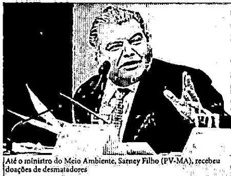
Até o ministro do Meio Ambiente, Sarney Filho (PV-MA), recebeu doações de desmatadores