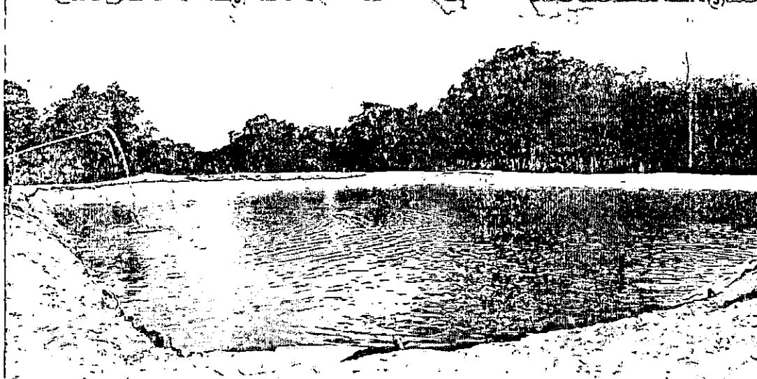
Governo participa de entrega poço, Telecentro, tanque para criação de peixes e canteiros de hortaliças - PÁGINA 2

Em Belágua, Governo participa de entrega de poço, Telecentro, tanque para criação de peixes e canteiros de hortaliças