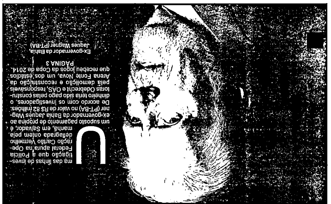
Ex-governador da Bahia, Jaques Wagner (PT-BA)

U mas das linhas de investigação que a Polícia Federal apura na Operação Cartão Vermelho, degraada ontem pela manhã, em Salvador, é um suposto pagamento de propina ao ex-governador da Bahia Jaques Wagner (PT-BA) no valor de R$ 82 milhões. De acordo com os investigadores, o dinheiro teria sido pago pelas construtoras Odebrecht e OAS, responsáveis pela demolição e reconstrução da Arena Fonte Nova, um dos estádios que recebeu jogos da Copa de 2014.