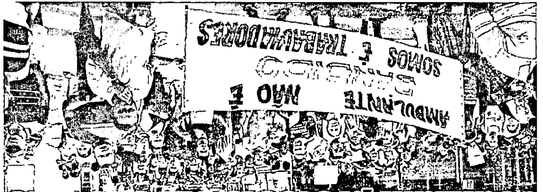
Vendedores reivindicam um espaço adequado para continuar atuando no comércio informal da capital - PÁGINA 2

Mulher estaquada 18 vezes pelo ex-companheiro está na UTI