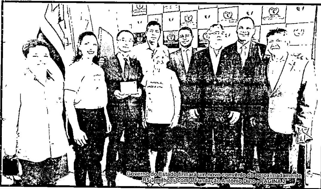
Governo do Estado firmará um novo convênio de aproximadamente R$ 3 milhões com a Fundação Antônio Dino - PÁGINA 2

Preso mais um suspeito de estupros no Teotônio Vilela, em Itz