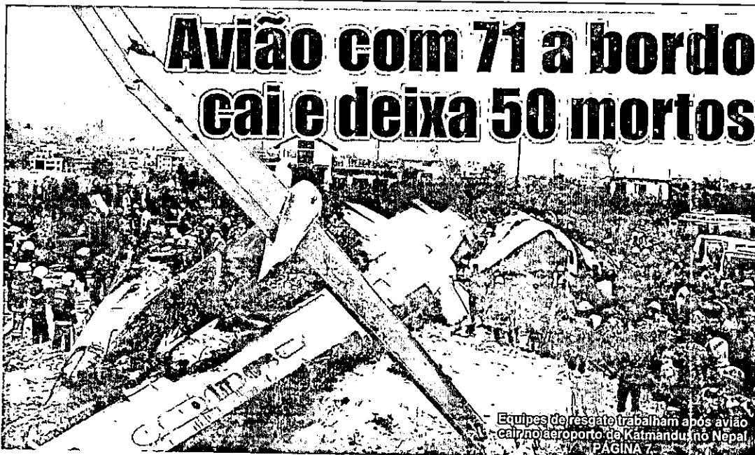
Equipes de resgate trabalham após avião cair no aeroporto de Katmandu, no Nepal