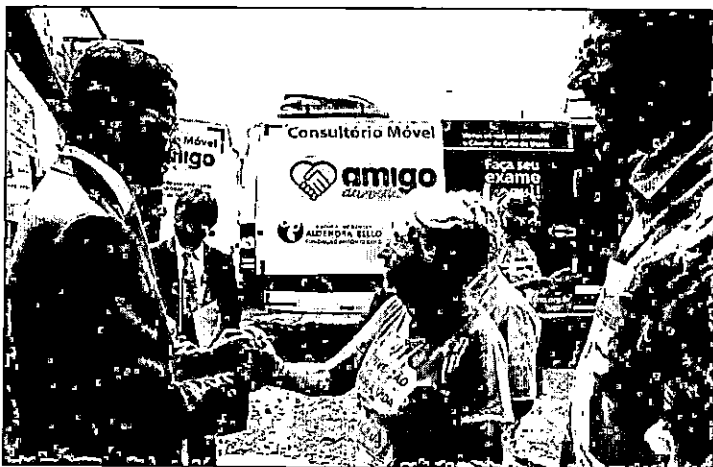
Governo do Estado firmará um novo convênio de aproximadamente R$ 3 milhões com a Fundação Antônio Dino

Após garantir recurso para a compra de um acelerador linear, que amplia o serviço de radioterapia para tratamento de pacientes oncológicos no Maranhão, o Governo do Estado firmará um novo convênio de aproximadamente R$ 3 milhões com a Fundação Antônio Dino (FAD) para finalização das obras civis no Hospital do Câncer Aldenora Bello (HCAB), onde os aceleradores lineares da unidade ficarão instalados.