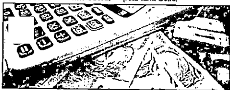
Antecipação só vale a pena para os contribuintes que estão realmente precisando com urgência do dinheiro

Com os investimentos realizados pelo Governo do Estado, o Maranhão tem apresentado um cenário mais positivo em relação à economia apesar da crise existente. Exemplo disso é que o Produto Interno Bruto (PIB) do Maranhão cresceu quase dez vezes mais do que o resto do país em 2017. Os dados são do relatório feito pelo Itaú Unibanco publicado pelo jornal Folha de São Paulo e apontam que enquanto o Maranhão cresceu 9,7% em 2017, o resto do país teve média 1%.