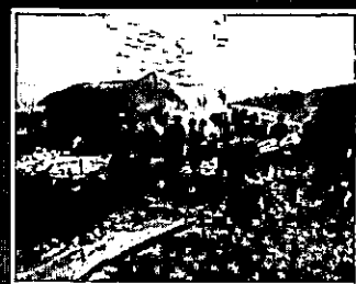
Aeronave tinha acabado de decolar da base aérea de Boufarik PÁGINA 7

Avião militar cai na Argélia e deixa 257 mortos