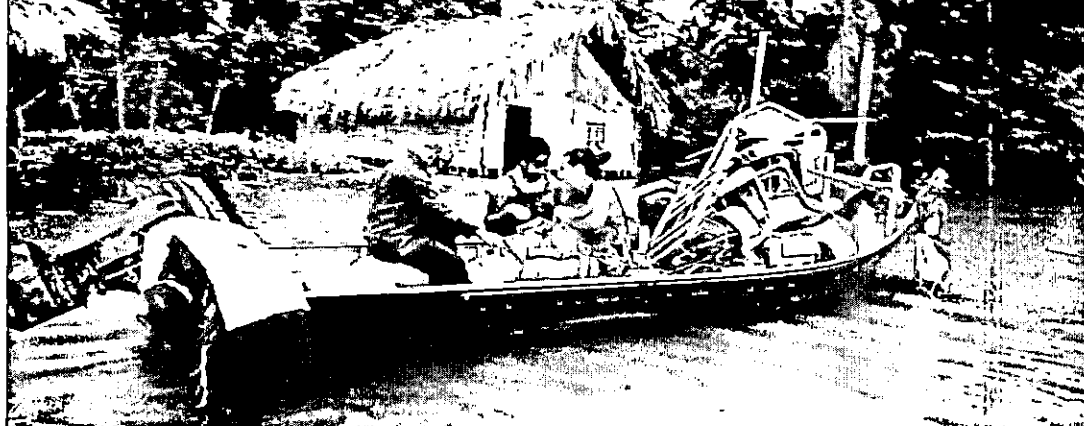
Equipes resgatam atingidos pela chuva em Caxias - PÁGINA 2

Equipes do Governo levam resgate, água e alimentos a prejudicados pelas chuvas