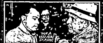
Equipes da Fesma

Fesma faz centenas de atendimentos para evitar doenças entre os prejudicados pelas chuvas