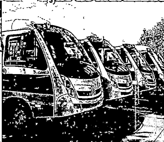
Todos os alunos da rede estadual receberam uniformes. Ônibus escolares transportam alunos com segurança - PÁGINA 10

Fesma faz centenas de atendimentos para evitar doenças entre os prejudicados pelas chuvas