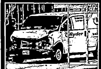
Homem que usou van para atropelar pedestres foi detido

Van atropela pedestres e deixa 9 mortos em Toronto