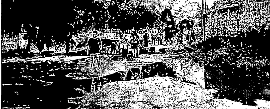
Protesto ocorre perto do Parque Independência - PÁGINA 2

Moradores voltam a protestar contra buraqueira em vias de SL