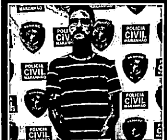
Otoniel foi preso após denúncias

Suspeito de tráfico de drogas é preso em residencial no Turu