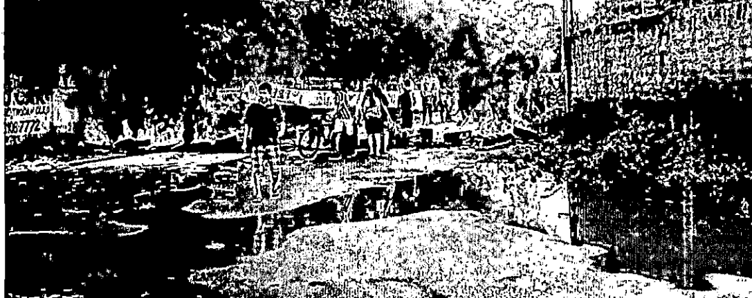
Protesto ocorre perto do Parque Independência - PÁGINA 2

Moradores voltam a protestar contra buraqueira em vias de SL