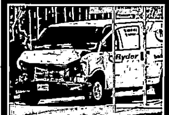
Homem que usou van para atropelar pedestres foi detido

Van atropela pedestres e deixa 9 mortos em Toronto