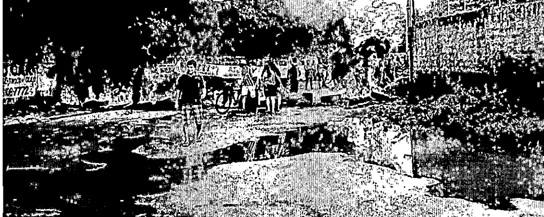
Protesto ocorre perto do Parque Independência - PÁGINA 2