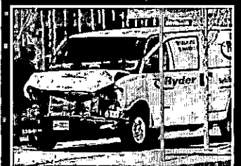
Homem que usou van para atropelar pedestres foi detido PÁGINA 7

Van atropela pedestres e deixa 9 mortos em Toronto