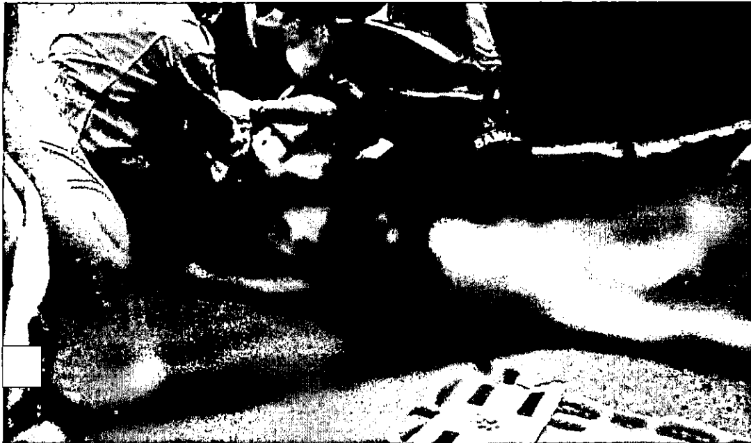
A IDOSA FOI JOGADA PARA FORA DO ÔNIBUS E DEPOIS ESMAGADA PELAS RODAS DO PESADO VEÍCULO. PÁGINA 8