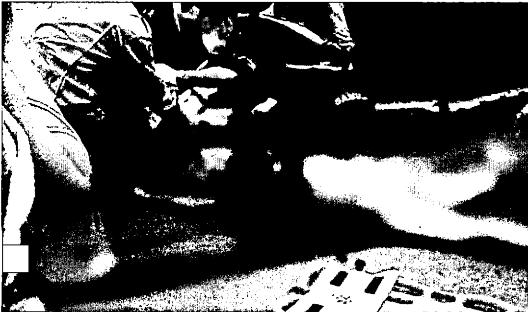
A IDOSA FOI JOGADA PARA FORA DO ÔNIBUS E DEPOIS ESMAGADA PELAS RODAS DO PESADO VEÍCULO. PÁGINA 8