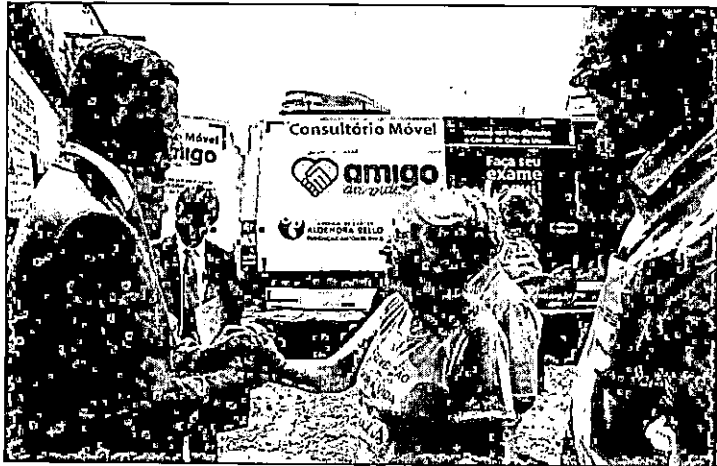
Governo do Estado firmará um novo convênio de aproximadamente R$ 3 milhões com a Fundação Antônio Dino

Após garantir recurso para a compra de um acelerador linear, que amplia o serviço de radioterapia para tratamento de pacientes oncológicos no Maranhão, o Governo do Estado firmará um novo convênio de aproximadamente R$ 3 milhões com a Fundação Antônio Dino (FAD) para finalização das obras civis no Hospital do Câncer Aldenora Bello (HCAB), onde os aceleradores lineares da unidade ficarão instalados.