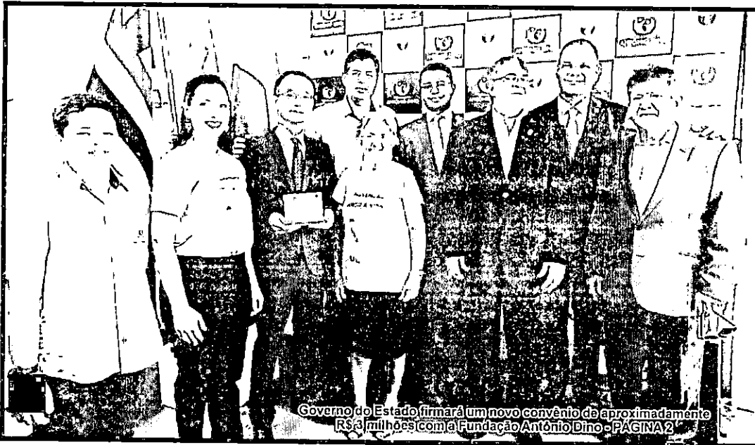
Governo do Estado firmará um novo convênio de aproximadamente R$ 3 milhões com a Fundação Antônio Dino - PÁGINA 2

Preso mais um suspeito de estupros no Teotônio Vilela, em Itz