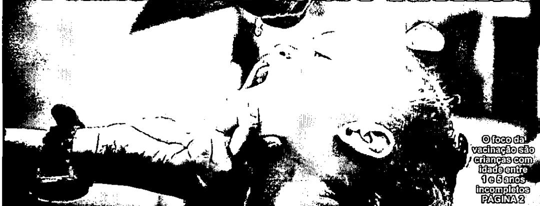
© foco da vacinação são crianças com idade entre 1 e 6 anos incompletos PÁGINA 2

Ministério reforça ações de combate às fake news sobre vacinas