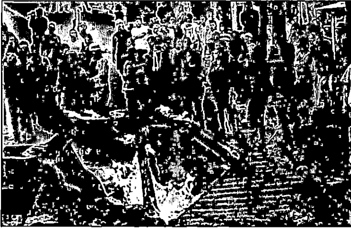
Manifestantes queimam carro em protesto em torno da sede da Guarda Nacional Bolivariana de Cotiza, na Venezuela

Autoridades da Venezuela divulgaram ontem (22) que detiveram 27 militares que realizaram um motim contra o presidente Nicolás Maduro na segunda, dois dias antes de manifestações opositoras para exigir um governo de transição e a realização de novas eleições.