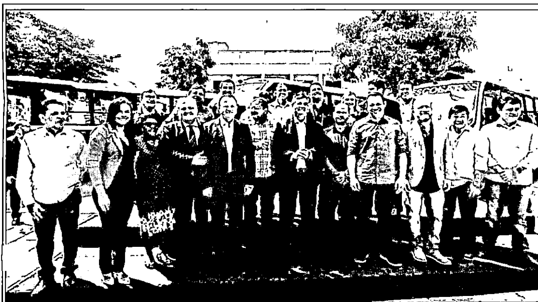
O governador Flávio Dino participou da entrega dos ônibus escolares para 11 municípios

Entrega ônibus escolares beneficia 3,5 mil estudantes de 11 municípios