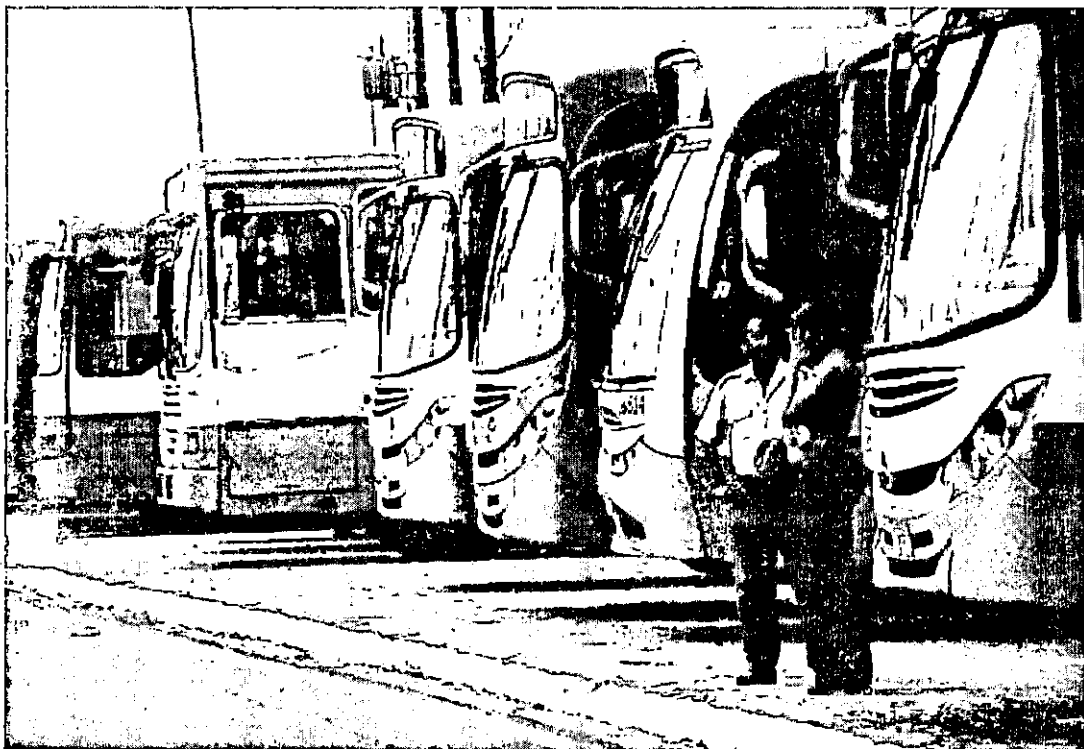
Com o impasse entre as categorias, os usuários mais uma vez são ameaçados de ficar sem ônibus

Após mais de quatro meses de negociações sem acordo, trabalhadores que atuam no transporte público da capital ameaçam cruzar os braços. A informações foi repassada na manhã desta quarta-feira (20) durante coletiva do Sindicato dos Rodoviários. PÁGINA 2