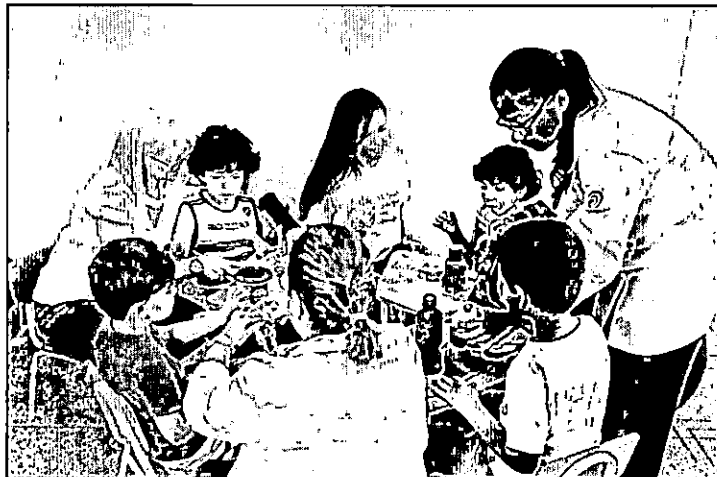
Equipe multidisciplinar atende crianças com autismo

Além deles, outras 35 crianças são assistidas pelo serviço semi-intensivo, com três sessões semanais - duas