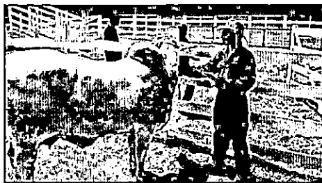
AGED fiscaliza saúde animal no estado

Em 2019, o Maranhão completou 15 anos sem focos de febre aftosa e o estado se prepara para ficar livre desse tipo de enfermidade sem a necessidade de vacina. Mas as ações de defesa animal no território maranhense não se restringem apenas ao combate à aftosa.