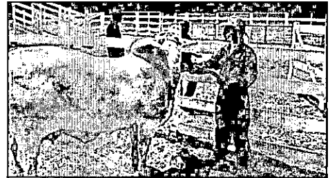
AGED fiscaliza saúde animal no estado

Em 2019, o Maranhão completou 15 anos sem focos de febre aftosa e o estado se prepara para ficar livre desse tipo de enfermidade sem a necessidade de vacina. Mas as ações de defesa animal no território maranhense não se restringem apenas ao combate à aftosa.