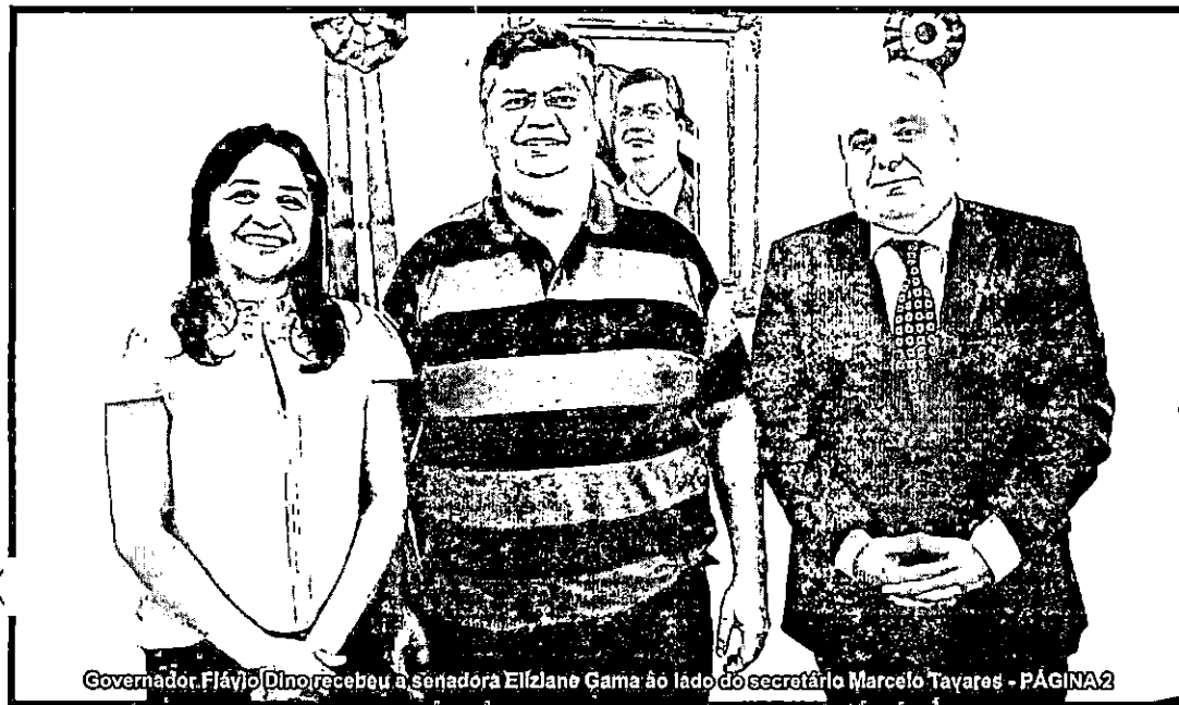
Governador Flávio Dino recebeu a senadora Eliziane Gama ao lado do secretário Marcelo Tavares - PÁGINA 2

Presos suspeitos de matar jovem a facadas PÁGINA 8