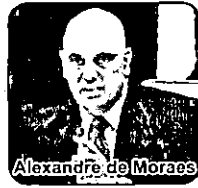
Alexandre de Moraes

Governo aceita alterar quatro pontos da reforma da Previdência para aprovar a PEC na CCJ PÁGINA 3