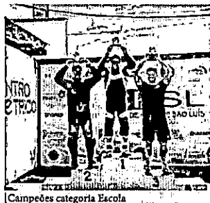
Campeões categoria Escola