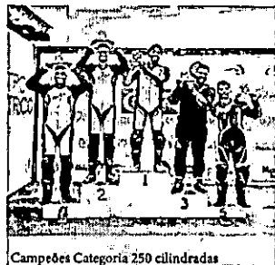
Campeões Categoria 250 cilindradas