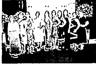
Empresárias do Conselho da Mulher Empresária do ACM