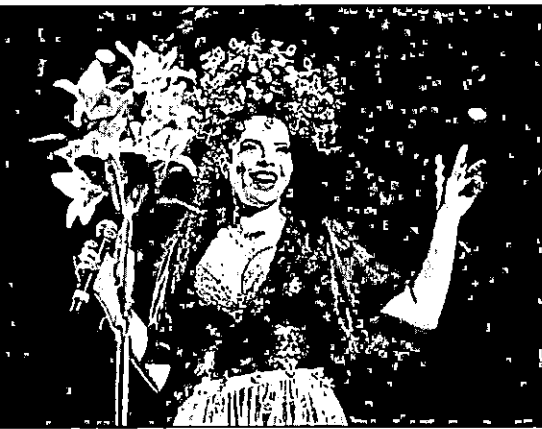
Vanessa da Mata

Já está confirmado: as cantoras Vanessa da Mata e Flávia Bittencourt vão se apresentar juntas no Carnaval de Todos 2019, em São Luís. Vai ser na terça-feira, dia 5 de março, no Circuito Beira Mar.