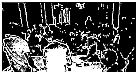
Dirigentes de clubes presentes no terceiro congresso técnico

Na realizado na terça-feira (29), o terceiro congresso técnico da 27ª Copa Interbairros de Futebol Amador, coordenada pela Federação de Ligas, Departamentos e Clubes de Futebol Amador do Maranhão – FLIDECFAM, considerada a maior competição do futebol amador do Maranhão. Durante a reunião foram discutidos vários assuntos, como regulamento da competição, números de inscritos, novos filiados e a participação de atletas profissionais. Na próxima reunião marcada para terça-feira, 04 de fevereiro, às 19h, na sede da Associação da Telemar/Oi (Av. Santos Dumont).