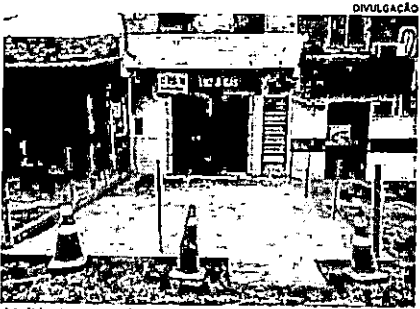
Medida visa evitar aglomerações em lotérica e pontos de saque de dinheiro. Público prevê, ainda, a disponibilização aos funcionários de equipamentos de proteção

A Promotoria de Justiça de Olinda Nova do Maranhão emitiu Recomendação, no dia 16 de abril, para uma casa lotérica e estabelecimentos comerciais onde funcionam pontos de saque de dinheiro, a fim de que sejam tomadas medidas de prevenção sanitária relacionadas à Covid-19. O documento foi destinado à Casa Lotérica Luz e Gás, Comercial Freitas, Lojas Nordestinas e Comercial Luz e Gás. Segundo o titular da Promotoria, o promotor de Justiça Márcio Antonio Alves de Oliveira, o pedido foi formulado em virtude da intensa aglomeração de pessoas nos referidos locais. Entre as medidas recomendadas estão a higienização semanal dos estabelecimentos, tanto nas superfícies quanto nos balcões e vidraças, em dias e horários de não funcionamento; e a disponibilização a funcionários