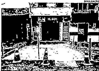
Medida visa evitar aglomerações em lotérica e pontos de saque de dinheiro e clientes de álcool em gel e/ou água e sabão. A Recomendação do Ministério Público prevê, ainda, a disponibilização aos funcionários de equipamentos de proteção