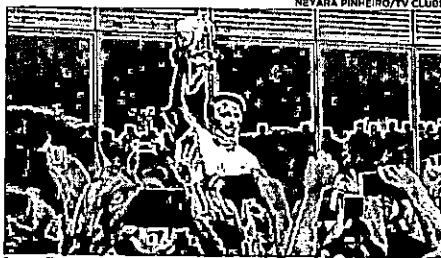
Em 1º evento público após Covid-19, Bolsonaro sobe em cavalo em meio à aglomeração sem usar máscara

O presidente Jair Bolsonaro apareceu, nessa quinta-feira (30), sem máscara de proteção individual e provocou aglomeração em seu primeiro evento público, após anunciar ter se recuperado da Covid-19. Foi no aeroporto de São Raimundo Nonato, no Piauí. Após descer do avião presidencial, ainda na área externa do terminal, Bolsonaro montou em um cavalo em meio a uma aglomeração de apoiadores e tirou a máscara que usava no rosto, tirou o chapéu e agradeceu a presença das pessoas. Em seguida, tocou na mão de apoiadores. Ele pegou, ainda, um microfone que foi estendido a ele e falou com a multidão. Decreto do governo do estado do Piauí, válido a partir do dia 13 de julho. Tornou obrigatório o uso de máscaras em todo o território piauiense. A desobediência está sujeita a multa que varia de R$ 500 a R$ 1 mil — em caso de