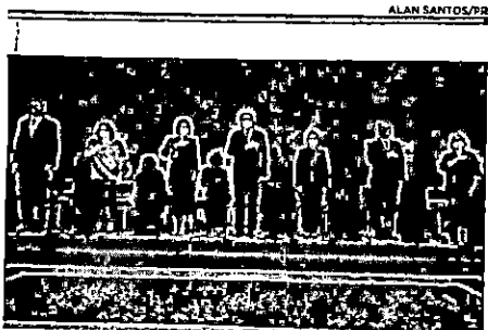
Primeira-dama Michelle Bolsonaro em solenidade no Palácio do Planalto, ao lado do presidente e de ministros, um dia antes do exame dar positivo para Covid-19.