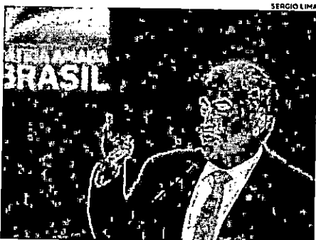
Marcos Pontes é o quinto ministro do governo Bolsonaro a testar positivo para Covid-19.

de Negócios e Investimentos na base com o Acordo de Salvaguardas Tecnológicas (AST) entre Brasil e Estados Unidos, aprovado no final do ano passado pelo Congresso Nacional e promulgado pelo presidente da República. No final da transmissão, o ministro Marcos Pontes revelou ter sentido sintomas de gripe e realizado o exame na terça-feira (20) e que o resultado saiu no dia seguinte. "Vou permanecer trabalhando no isolamento e continuar a despachar normalmente com isolamento. A gente vai tratar e tudo vai dar certo de Deus quiser. Vou até enfiar nos testes da nitazonxida, agora eu posso", acrescentou. (Gil Maranhão)