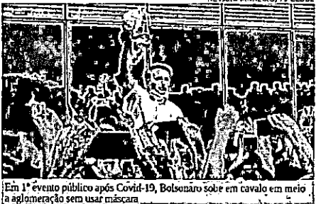
Em 1º evento público após Covid-19, Bolsonaro sobe em cavalo em meio a aglomeração sem usar máscara

O presidente Jair Bolsonaro apareceu, nessa quinta-feira (30), sem máscara de proteção individual e provocou aglomeração em seu primeiro evento público, após anunciar ter se recuperado da Covid-19. Foi no aeroporto de São Raimundo Nonato, no Piauí. Após descer do avião presidencial, ainda na área externa do terminal, Bolsonaro montou em um cavalo em meio a uma aglomeração de apoiadores e tirou a máscara que usava no rosto, tirou o chapéu e agradeceu a presença das pessoas. Em seguida, tocou na mão de apoiadores. Ele pegou, ainda, um microfone que foi estendido a ele e falou com a multidão. Decreto do governo do estado do Piauí, válido a partir do dia 13 de julho. Tornou obrigatório o uso de máscaras em todo o território piauiense. A desobediência está sujeita a multa que varia de R$ 500 a R$ 1 mil – em caso de