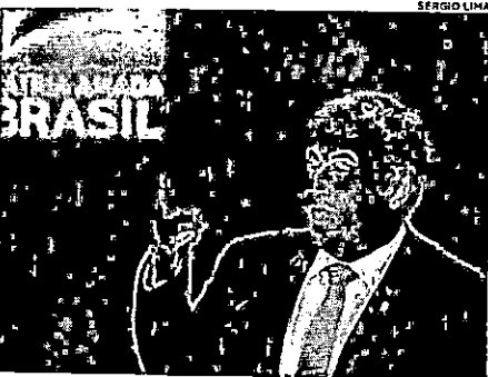
Marcos Pontes é o quinto ministro do governo Bolsonaro a testar positivo para Covid-19.

de Negócios e Investimentos na base com o Acordo de Salvaguardas Tecnológicas (AST) entre Brasil e Estados Unidos, aprovado no final do ano passado pelo Congresso Nacional e promulgado pelo presidente da República. No final da transmissão, o ministro Marcos Pontes revelou ter sentido sintomas de gripe e realizado o exame na terça-feira (28) e que o resultado saiu no dia seguinte. "Vou permanecer trabalhando no isolamento e continuar a despachar normalmente com isolamento. A gente vai tratar e tudo vai dar certo de Deus quiser. Vou até entrar nos testes da nitazoxanida, agora eu posso", acrescentou. (Sil Maranhão)