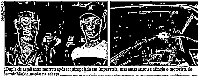
Dupla de assaltantes morreu após ser atropelada em Imperatriz, mas antes atirou e atingiu o motorista do caminhão de raspão na cabeça

Na sexta-feira (22), dois homens utilizaram uma motocicleta para assaltar um caminhão de entrega de bebidas, na BR-010, próximo à ponte Barra Grande, no município de Imperatriz. A dupla atingiu de raspão o condutor com tiros de arma de fogo, que perdeu o controle do veículo de carga e foi em direção aos suspeitos da tentativa de assalto. Eles foram atropelados pelo veículo, indo a óbito ainda no local da ocorrência. O caso aconteceu no final da tarde, na altura do km 267,5 da rodovia Belém/Brasília, na zona rural da cidade de Imperatriz. O caminhão era um VW/8.150, de cor branca, que seguia no sentido decrescente da via (de Açailândia para Imperatriz). Após fazer algumas entregas, retornou com um pouco da carga e com o dinheiro arrecadado. Já a motocicleta utilizada pelos assaltantes era uma Honda/CG 150 Titan. A dupla deu ordem de