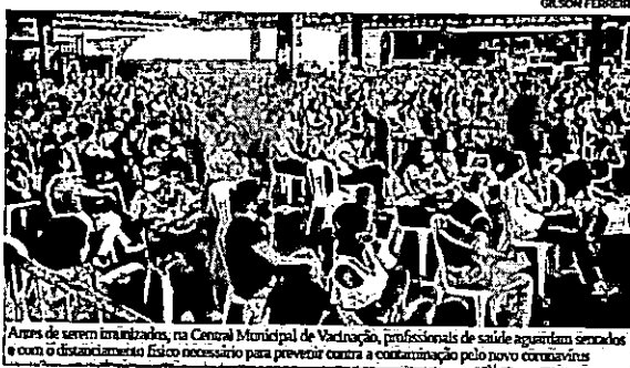
Após de serem imunizados, na Central Municipal de Vacinação, profissionais de saúde aguardam ser servidos e com o distanciamento físico necessário para prevenir contra a contaminação pelo novo coronavírus