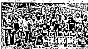
Novos times de brigadistas de incêndio e de socorristas Potiguar

O Grupo Potiguar prioriza a Segurança em todas as lojas e demais áreas, além de investir fortemente em treinamentos. E, defendendo sempre essa política, acaba de formar novos times de colaboradores voluntários que integram a sua Brigada de Incêndio e de Socorristas, em São Luís e em Imperatriz. Os novos brigadistas estudaram temas como: Classes de fogo, Tipos de Extintores, Simulações Preventivas do Primeiro Socorro, Rota de Fuga, Queimaduras, Choque Elétrico, Inspeção de Hidrantes e Extintores além de exercícios simulados de socorro a vítimas, entre outras questões relevantes para a manutenção da segurança e do bem estar geral.