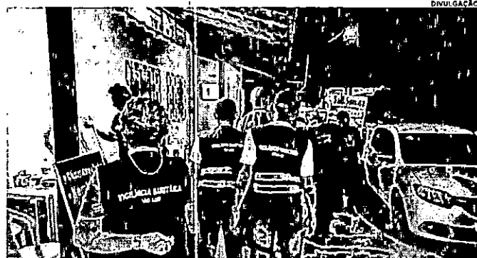
Equipes da Prefeitura seguem com disciplinamento de bares e restaurantes, na capital

A Secretaria Municipal de Saúde (Semus) tem dado continuidade às ações de fiscalização e disciplinamento de estabelecimentos, bares, lanchonetes, praças de alimentação e similares na capital. Os trabalhos fazem parte das ações do Município visando o cumprimento do Decreto Municipal nº 56.887/21 e do Decreto Estadual nº 36.582, que estabelece as diretrizes de funcionamento desses locais. A ação é realizada pela Vigilância Sanitária Municipal, e conta com a participação da Blitz Urbana e da Guarda Municipal de São Luís. Um balanço dos trabalhos até a última segunda-feira (15), aponta que já foram fiscalizados 173 estabelecimentos e destes, 21 foram autuados por estarem funcionando em desacordo com o que foi estabelecido pelo Município. Nessa terça-feira (16), com início às 20h, a fiscalização transcorreu normalmente nas ruas da capital. Conforme o documento, os estabelecimentos que tiveram funcionamento presencial vedado por sete dias, poderão manter somente os serviços delivery, ou seja, de entrega na residência ou ponto de interesse do cliente; e ainda no sistema drive-thru, até às 23h. As medidas restritivas de enfrentamento à pandemia