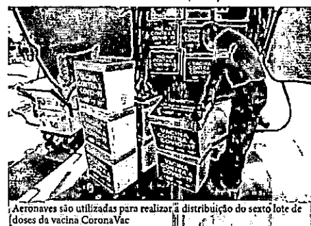
Aeroplanos são utilizados para realizar a distribuição do sexto lote de doses da vacina CoronaVac

O Governo do Maranhão finalizou nessa terça-feira (16) a distribuição do sexto lote de doses da vacina CoronaVac às 18 Regionais de Saúde do estado. Para agilizar o envio, sobretudo às cidades mais distantes, o transporte contou com o apoio de dois helicópteros do Centro Tático Aéreo (CTA), da Polícia Militar do Maranhão (PMMA). As vacinas do lote que chegou na última semana são para a imunização de idosos de 75 a 84 anos e trabalhadores da saúde. A distribuição da primeira dose do sexto lote da CoronaVac teve início na quinta-feira (11) aos municípios da Região Metropolitana. Na segunda-feira (15), uma aeronave levou as vacinas às Regionais de Imperatriz, Açailândia e Balsas e, ontem (16), os imunizantes foram entregues às demais Regiões de Saúde. Além das aeronaves, a Secretaria de Estado da Saúde (SES), responsável pela distribuição das vacinas, conta com o auxílio de vans refrigeradas, que fazem o transporte das regionais aos municípios, caso estes não tenham condições de fazer o deslocamento. "Esta entrega é referente também à segunda dose da remessa