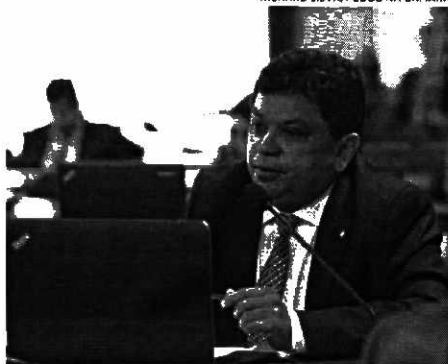
Presidente da Frente Parlamentar de Defesa do SUS, deputado Márcio Jerry dá como exemplo o fortalecimento da saúde nas gestões dos governadores Flávio Dino e Carlos Brandão

Em entrevista à Rádio Câmara, veiculada nessa terça-feira (13), o presidente da Frente Parlamentar Mista pelo Fortalecimento do Sistema Único de Saúde (SUS) no Congresso Nacional, deputado federal Márcio Jerry (PCDoB), destacou o exemplo de fortalecimento da saúde liderado no Maranhão pela gestão dos governadores Flávio Dino e Carlos Brandão. O deputado deu ênfase à combinação de implantação planejada de policlínicas e hospitais macrorregionais no estado, e falou da importância de promover investimentos para tornar a saúde pública eficaz. A emissora, ele declarou apoio a uma proposta que deverá ser votada em breve por parlamentares, determinando a revisão periódica, a cada mês de dezembro, da tabela de remuneração dos serviços prestados ao SUS. Na visão do parlamentar, a principal justificativa para a aprovação é a constatação de uma grande defasagem nos valores repassados às entidades