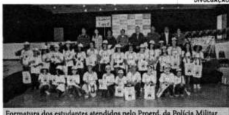
Formatura dos estudantes atendidos pelo Proerd, da Polícia Militar