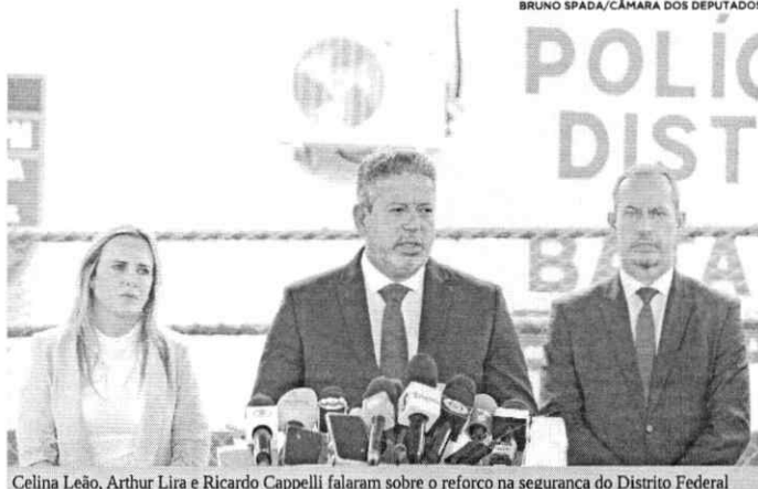
Celina Leão, Arthur Lira e Ricardo Cappelli falaram sobre o reforço na segurança do Distrito Federal

A segurança do Distrito Federal será reforçada no dia 1º de fevereiro para evitar que se repitam, no dia em que os poderes Legislativo e Judiciário reiniciam os trabalhos, cenas como as registradas no último dia 8, quando vândalos e golpistas invadiram e destruíram partes do Palácio do Planalto, do Congresso Nacional e do Supremo Tribunal Federal (STF). O anúncio foi feito ontem (16) pelo presidente da Câmara dos Deputados, Arthur Lira (PP-AL), a governadora em exercício do Distrito Federal, Celina Leão, e o interventor federal na segurança da capital, Ricardo Cappelli. "Nossa preocupação, agora, é com a posse de 513 deputados e 81 senadores", disse Lira, ao final da visita que ele, Celina e Cappelli fizeram, pela manhã, ao prédio da Câmara dos Deputados, onde funciona o Batalhão da Polícia Militar (PM), responsável pelo patrulhamento ostensivo na área da Praça dos Três Poderes. "Entendo que todo o planejamento está sendo bem cuidado para não termos nenhuma surpresa e, com certeza, não haverá", acrescentou Lira, dando como certo o reforço da segurança. A seu lado, Cappelli assentiu com a cabeça e a governadora em exercício acrescentava: "com certeza". "[No Congresso Nacional],