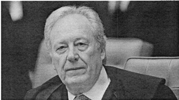
O ministro Ricardo Lewandowski determinou que três ações contra o presidente Lula fossem encerradas

O ministro Ricardo Lewandowski, do Supremo Tribunal Federal (STF), determinou o encerramento de três ações penais contra o presidente da República, Luiz Inácio Lula da Silva. Elas tratam da aquisição da sede e de doações ao Instituto Lula e de supostas irregularidades na aquisição de caças suecos Saab-Gripen para a Força Aérea Brasileira (FAB) no governo Dilma Rousseff. Os processos já estavam suspensos em razão de liminares concedidas na Reclamação (RCL) 43007, com base na ilicitude das provas. Como as versões dos colaboradores não foram confirmadas por outros documentos, a Polícia Federal concluiu, nessa quarta-feira, 22, que o senador Renan Calheiros (MDB-AL) não recebeu propina relativa a contratos da Transpetro, empresa de transporte e logística de combustíveis subsidiária da Petrobras. A investigação, originada na "lava jato" e em trâmite no Supremo Tribunal Federal, diz respeito a um suposto esquema de corrupção na transportadora, com repasses de propinas a