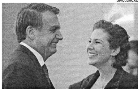
Para Bolsonaro, Carla Zambelli fez acordo com Alexandre de Moraes, do STF

O ex-presidente Jair Bolsonaro afirmou a interlocutores com quem mantém contato direto no Brasil que foi traído pela deputada federal Carla Zambelli (PL-SP). Bolsonaro disse acreditar que a parlamentar fez um acordo com o ministro do Supremo Tribunal Federal (STF) Alexandre de Moraes para retornar às redes sociais e se ver livre da ameaça de ser preso. Ele teve essa certeza no dia 6 de fevereiro, quando leu a