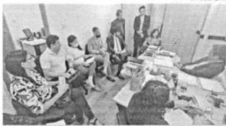
Reunião contou com a participação de membros do MPMA e de representantes do Município de São Luís