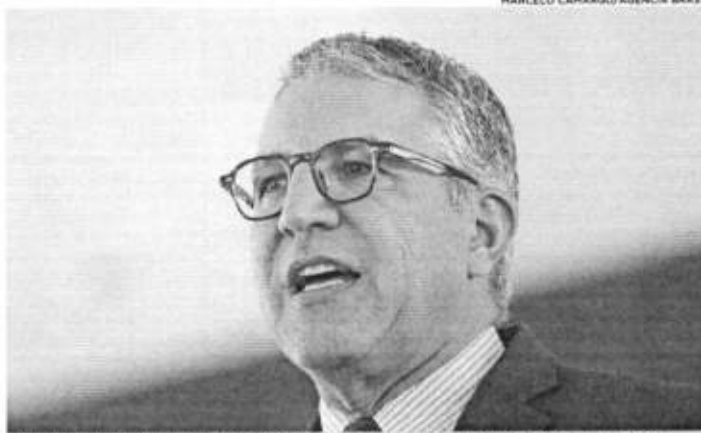
Ministro Alexandre Padilha explicou como se dará o processo para análise das medidas provisórias

O ministro das Relações Institucionais, Alexandre Padilha, disse, nessa terça-feira (4), em Brasília, que o governo fechou acordo com o Congresso para instalação de comissões mistas para análise de quatro medidas provisórias (MPs) enviadas pelo presidente Luiz Inácio Lula da Silva. No total, o governo tem 12 MPs com vencimento até início de agosto na fila para avaliação dos parlamentares.