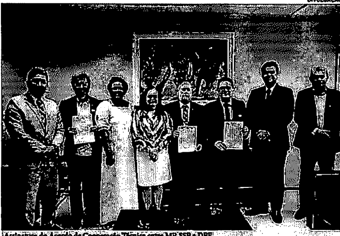
Assinatura do Acordo de Cooperação Técnica entre MP, SSP e DPE.